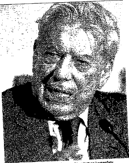
Mario Vargas Llosa a primit Nobelul pentru literatură pe 7 octombrie

ce au murit, a explicat Llosa. Altfel, care are dubiă cetățenie - peruian și spaniol -, a mai spus că, deși este foarte obosit, resimte „o imensă dorință de a scrie”, această activitate fiind întreruptă în ultimele luni de conflictivitate susținută după ce a primit, pe 7 octombrie, premiul Nobel pentru literatură pe 2010. Scriitorul a declarat că se va manifesta din nou pe scena politică, până la alegerea prezidențială din luna aprilie, „dacă democrația peruiană riscă să fie amenințată”. Llosa a precizat că va încerca „prin toate mijloacele legale” să se opună alegerii în funcția de președinte al statului Peru a lui Keiko Fujimori, fosta soție a președintelui Alberto Fujimori. În prezent închis pentru violarea drepturilor omului, Peruianul Mario Vargas Llosa, a primit Nobelul pentru „cargoferea structurilor puterii, pentru descoperirea sale patrumozice care vorbesc despre rezistența în individuali, revoluția și eşecul său”.