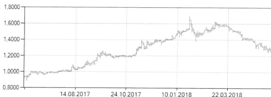
Graficul nr. 1- Evolutia pretului de inchidere al actiunilor Societatii Vizate

Evolutia pretului de inchidere pe actiune si a volumului de tranzactionare in ultimele 12 luni anterioare depunerii documentatiei de Oferta Publica la ASF, asa cum sunt prevazute pe website-ul Bursei de Valori Bucuresti ( www.bvb.ro ), sunt prezentate in graficele de mai jos: