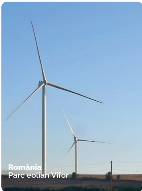
România Parc eolian Vifor

Grup EM derulează proiecte majore în domeniul energiei regenerabile, consolidând expertiza în parcuri eoliene și infrastructură de transmisie. Proiectul Parcului Eolian Ruginoasa, finalizat în 2023, a reprezentat cel mai mare parc eolian din Moldova, cu o capacitate de 60 MW pe o suprafață de 23 de hectare, incluzând fundații pentru turbine, platforme pentru echipamente, drumuri de acces și o rețea de colectare de 35 kV conectată la Sistemul Energetic Național.