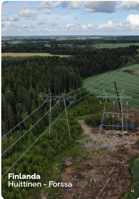
Finlanda Huittinen - Forssa

electrice aerienă 400 kV Huittinen – Forssa în Finlanda, modernizări de linii 380 kV în Țările de Jos și proiecte 400 kV în Polonia, toate implicând proiectare, construcție și montaj de structuri și conductori de înaltă tensiune.