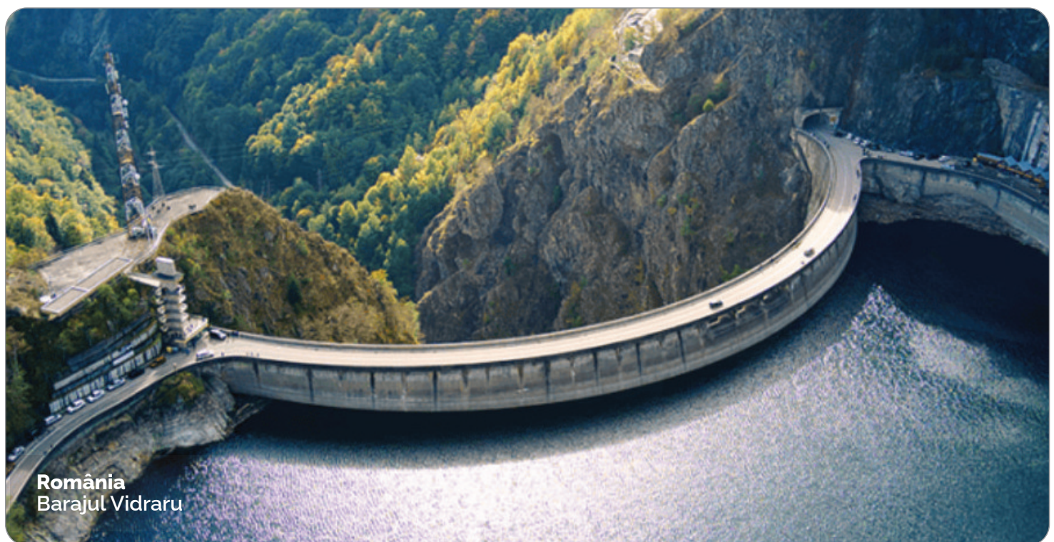
România Barajul Vidraru

Aceste proiecte reflectă capacitatea Grup EM de a livra soluții integrate în domeniul hidroenergetic și al irigațiilor, contribuind la dezvoltarea durabilă și modernizarea infrastructurii critice la nivel național.